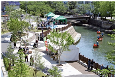
水辺を生かした空間の整備