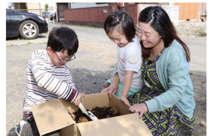
ダンボールコンポスト(たい肥づくり)