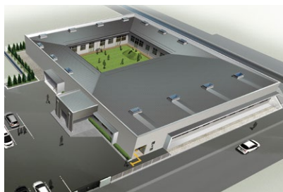
障がい児通所支援施設「ひまわり学園」 改築イメージ図