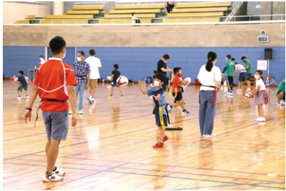
OGAKI スポーツフェスティバル