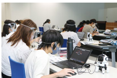
小学生親子ものづくり体験講座