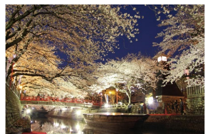
大垣船町川湊 (夜桜のライトアップ)