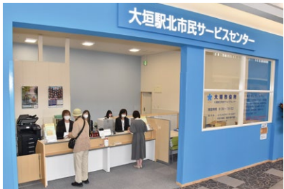
大垣駅北市民サービスセンター

※ (1)(2)等が分野、①②等が施策を示しています。 ※ SDGsのゴールは、未来のピース毎に主なものを抜粋して掲載しています。