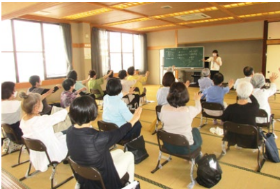
「飛び出す市役所」出前講座