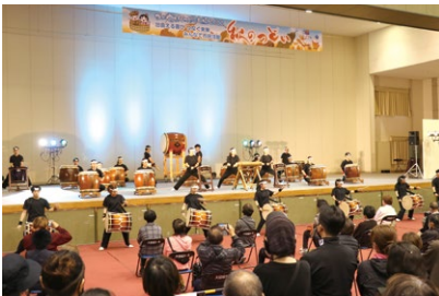
かがやきライフタウン大垣 秋のつどい