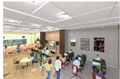
「(仮称) デジタルひろば」イメージ図