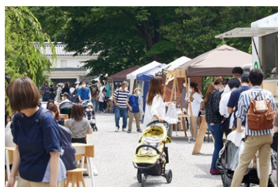
まちなかスクエアガーデン