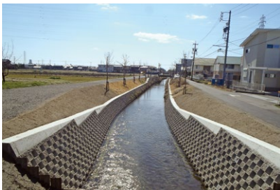
曾根川の護岸改修工事