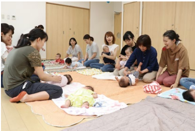
キッズピアおおがき子育て支援センター