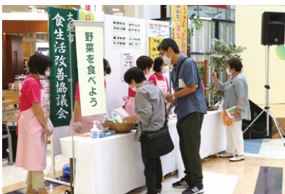
ヘルシーおおがきフェア