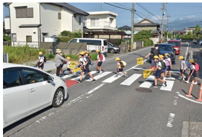
子どもたちの登下校の見守り活動