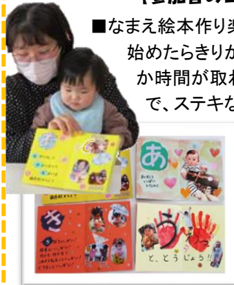
▲お気に入りのページ