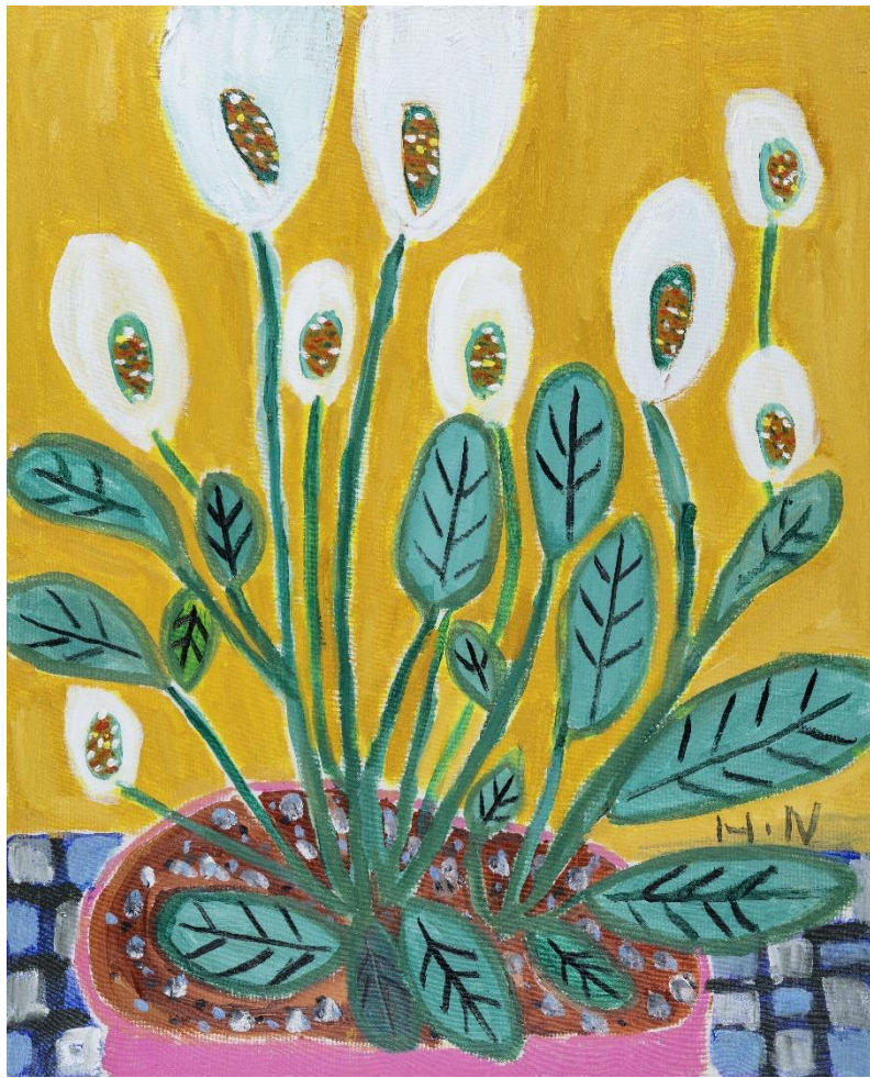
作品名：「スパティフィラム」 作者：西脇 秀威 ふれあいアートステーション・ぎふ登録作品