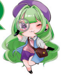
《イラスト協力》 大垣女子短期大学

もし、「被害に遭った」「おかしいな…」と心配な時や、困った時は一人で悩まず、すぐにお電話ください。