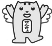
明るい選挙推進運動 イメージキャラクター めいすいくん