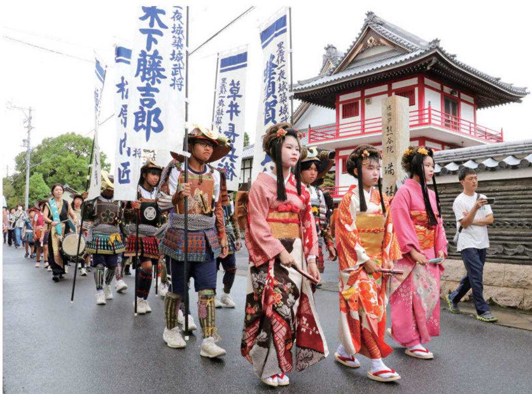
姫や武將に扮して町内を練り歩く子どもたち