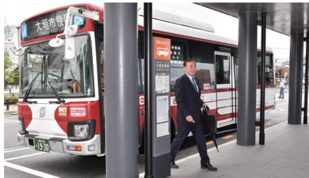
大垣駅からは名阪近鉄バスに乗り換えて市役所に到着

本市では、持続可能なまちづくりの一つとして、公共交通の維持・活性化などに取り組んでおり、令和5年10月からは「水都大垣スマート通勤」の取り組みも、新たにスタートしました。