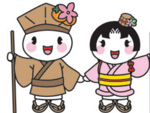
市マスコットキャラクター おがっきい&おあむちゃん