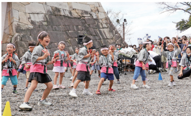
よさこい踊りを元気よく披露する墨俣保育園の園児たち

地域振興につなげようと毎年実施されている歴史と文化あふれるイベントで今年で28回目。地元の小・中学生らによる「武者行列」がオープニングを飾り、姫や武將に扮して、墨俣小学校から墨俣一夜城址公園までの約1.4kmを練り歩きました。