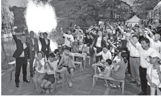
「川の日」に合わせて実施した「水辺で乾杯」

そのほか「水都大垣ブルーライトアップ」や「足水体験」などを実施しており、今後も「湧水のまち水都大垣」の魅力を広く発信していきます。