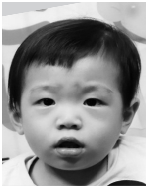
深江 倅叶くん(一歳)