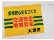
交通・地域安全手旗