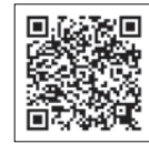
キッチンカースケジュール

市役所庁舎西側の丸の内公園では、毎週金曜日のランチタイムにテラス席を設け、キッチンカーが週替わりで出店する『まるのうちテラス』を実施しています。ぜひご利用ください。