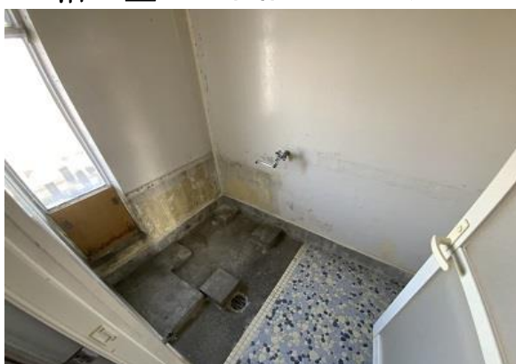
浴室 ※浴槽はついておりません