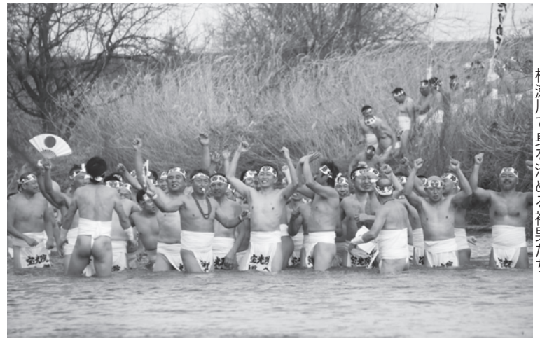
杭瀬川で身を清める裸男たち

「ひだりめ不動」の名で知られる野口の宝光院で2月3日、厄よけ・開運を願う恒例の「節分会はだか祭」が行われました。