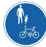
「普通自転車等及び歩行者等専用」