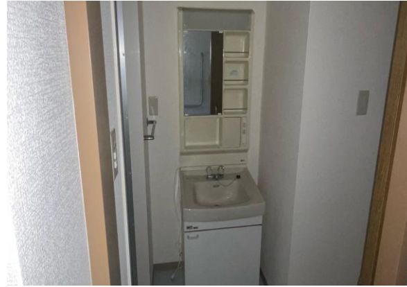
洗 面 所