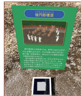
飛び出す現地解説