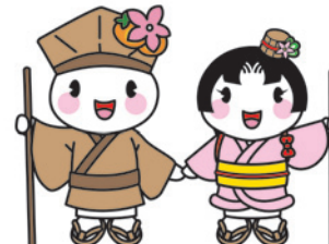
市マスコットキャラクター おがっけい&おあむちゃん