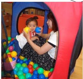
ボールがいっぱいだね～♡