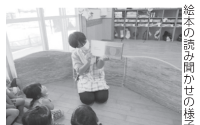
絵本の読み聞かせの様子