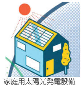
家庭用太陽光発電設備