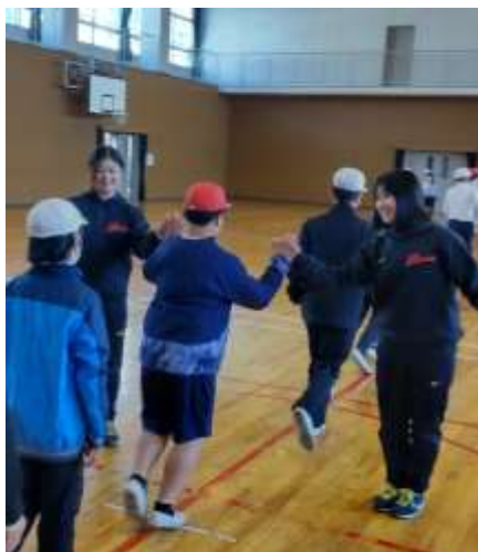
【選手とゲームをする様子】

「捕る」「投げる」「打つ」「走る」などの基本的な技能を習得させるとともに、体を動かすことの楽しさや喜びを体験させる。