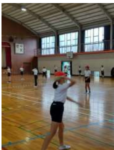
【キャッチボールをする様子】