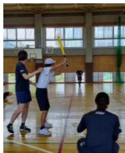
【投球を体験する様子】