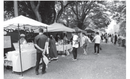
同イベントの様子