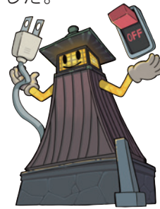
節電すみよしとう台

「大垣市×SDGsお化けを探せ」発表会では、第Ⅱ期の作品募集を夏休みの作品募集の一環として実施し、応募総数約600体の中から5体の優秀作品が発表され、リライト作品が初披露されました。