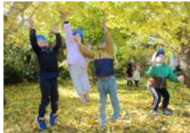
「ジャンプ！もうちょっとで、とどく！」