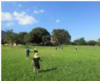
「坂の上まで走るよ〜！」