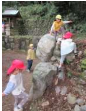
「この石をつかんで！」

全身を十分に動かす経験を重ねることで、体幹やバランス感覚、力の加減、タイミングをつかむ力、目と体を連動させる力が育ちます。これらの力を土台として、指先を使った制作や操作遊びといった微細運動が安定し、より巧みに行えるようになってきます。