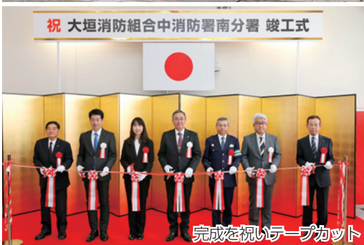
完成を祝いテープカット