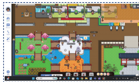
メタバース相談室のイメージ