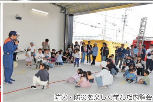
防火・防災を楽しく学んだ内覧会

大垣消防組合が令和3年度から移転新築工事を進めていた「中消防署南分署」が横曽根地内に完成し、4月22日に運用を開始しました。