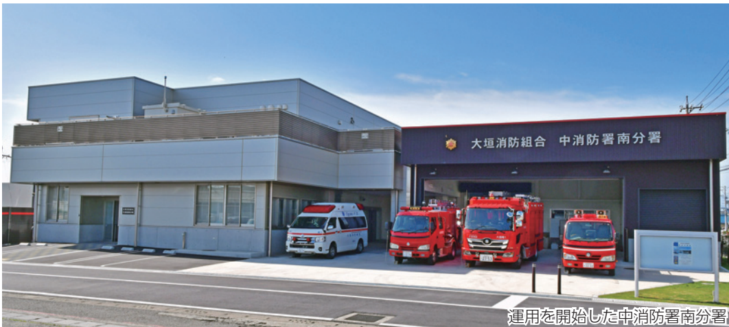
運用を開始した中消防署南分署