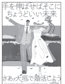
手を伸ばせばそこに ちょうどいい未来 さあ、大垣で婚活しよう