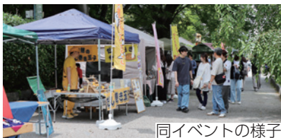
同イベントの様子