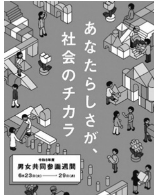
令和8年度 内閣府の男女共同参画週間ポスター