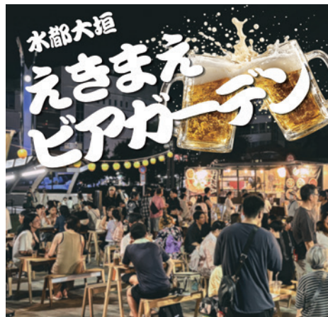
水都大垣再生プロジェクト2.0