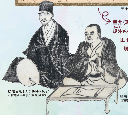
松尾芭蕉さん(1644~1694) 〔俳諧百一集〕所収