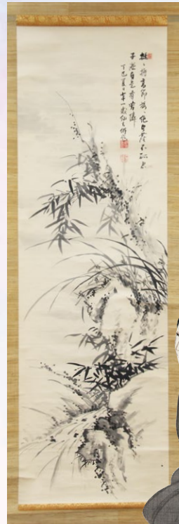
江馬細香さん(1787~1861) 〔白鶴社集會図〕 〔個人蔵 岐阜県歴史資料館寄託〕より