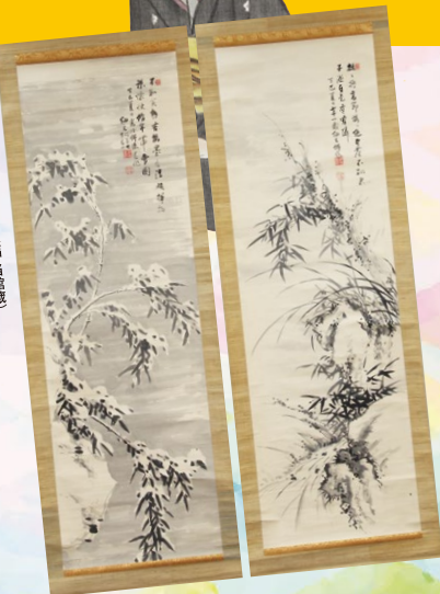
江馬細香筆 蘭竹・雪竹図(双幅)(当館蔵) 江馬細香肖像(白鷺社集会館) (個人蔵 岐阜県歴史資料館寄託より)

令和8年 7月18日 [土] 8月30日 [日] 開館時間 9:00~17:00