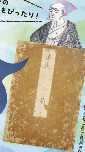
「猿蓑」(当館蔵) 凡兆肖像(俳諧百一集)(当館蔵)所収

日時: 7月19日 [日] 7月26日 [日] 8月23日 [日] 8月30日 [日] いずれも14:00~ 30分程度