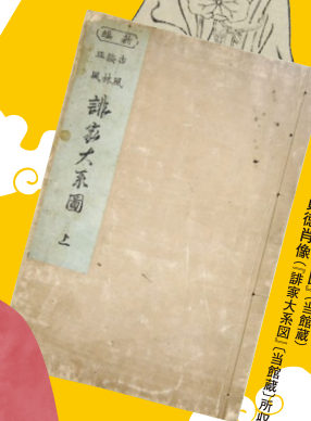
「誦家大系図」(当館蔵) 貞徳肖像(誦家大系図)(当館蔵)所収