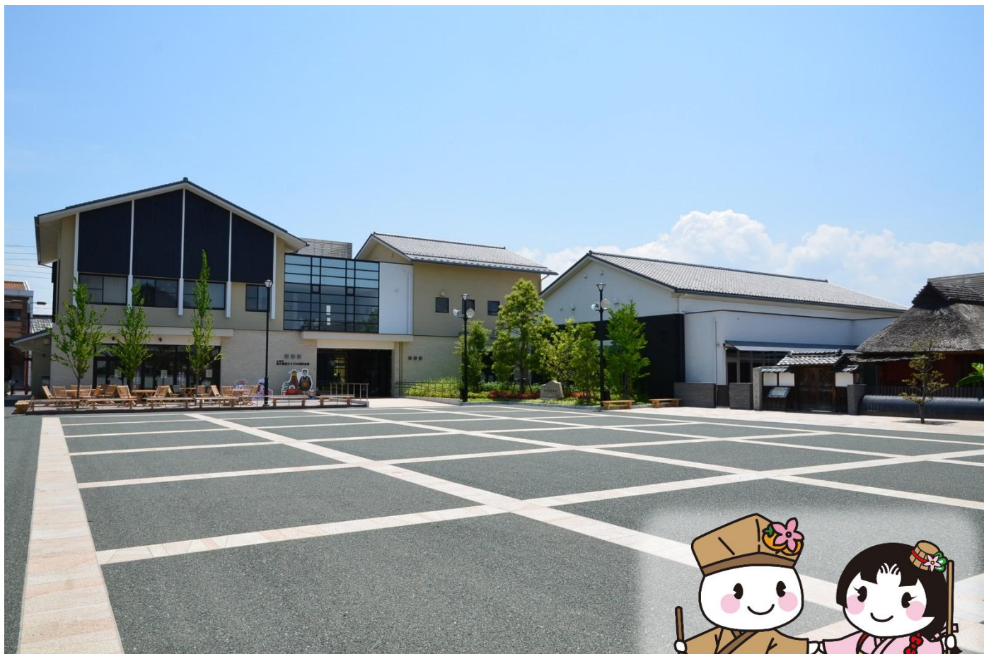
奥の細道むすびの地記念館

※申込書の個人情報は、本事業以外の目的には一切使用しません。 ※会場整理のため、欠席の場合は、前日までにご連絡ください。