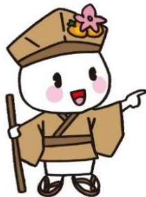
大垣市マスコットキャラクター おがつきい