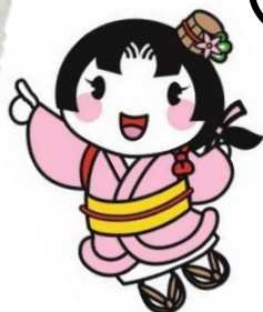
大垣市マスコットキャラクター おあむちゃん