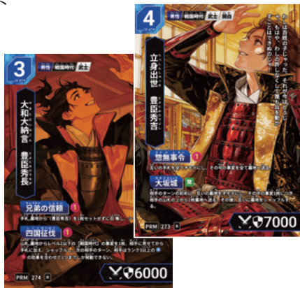
参加特典カード 左：豊臣秀長 右：豊臣秀吉