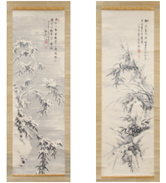
江馬細香筆 蘭竹・雪竹図

奥の細道むすびの地記念館に収蔵されている芭蕉や『奥の細道』、俳諧、大垣ゆかりの先賢に関する資料を展示し、それぞれの資料がもつ魅力やおもしろさについて紹介します。