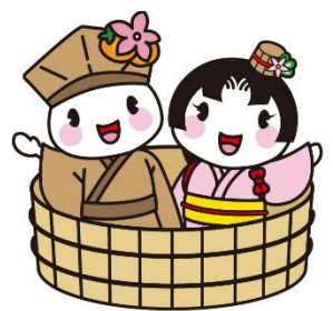
大垣市マスコットキャラクター おがっきい&おあむちゃん