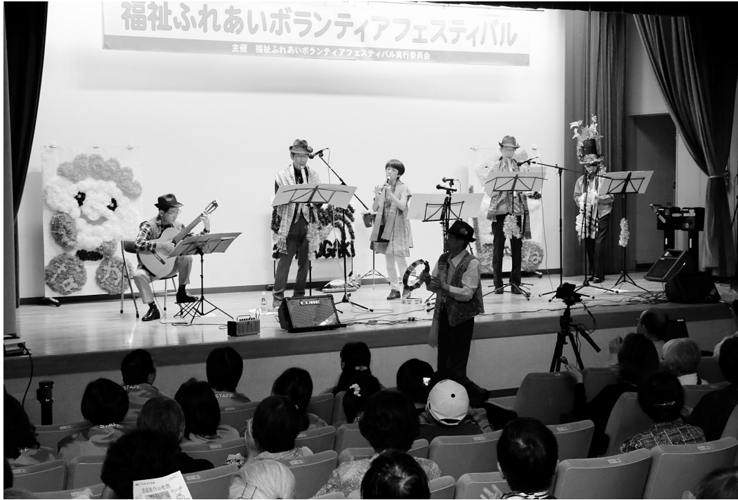
福祉ふれあいボランティアフェスティバル