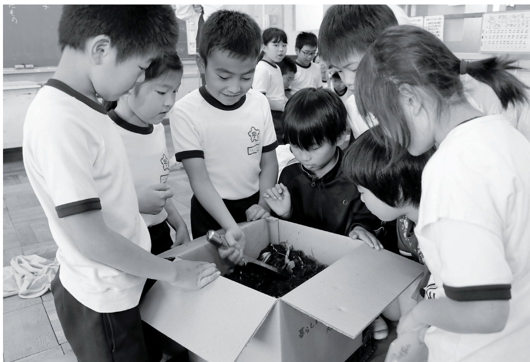
ダンボールコンポスト作り