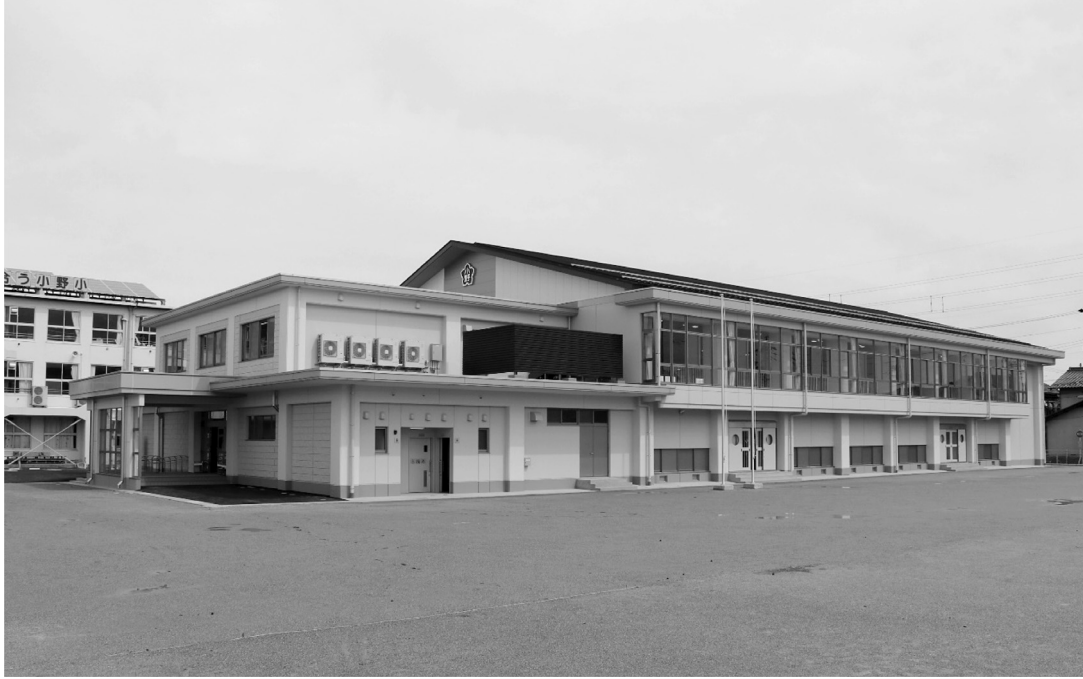
小野小学校新体育館 完成