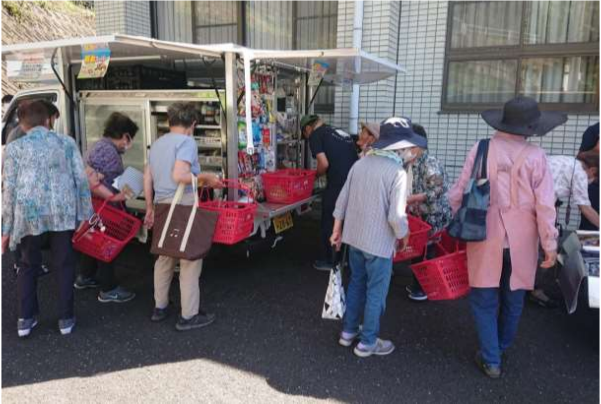
移動販売車による買い物支援（上石津老人福祉センター）