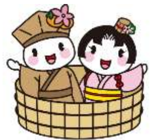
大垣市マスコットキャラクター おがっさい&おあむちゃん