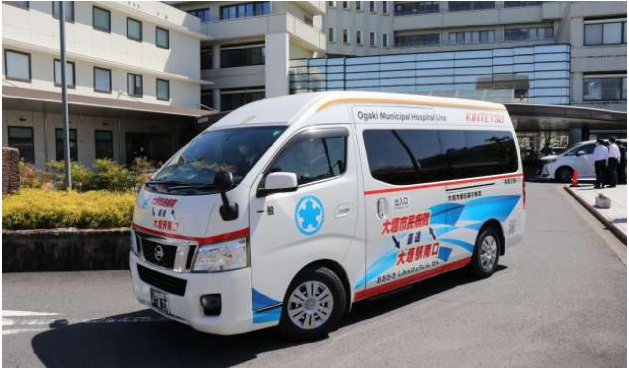
大垣市民病院線の運行開始