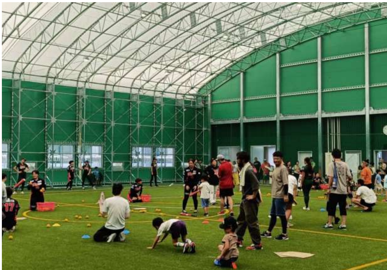
新田屋内運動場「ミナモスマイルドーム」